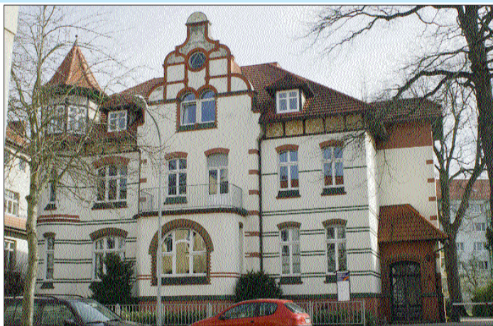
Das neue Beratungsangebot finden Sie in Salzwedel in der Goethestraße 26.

Im Übrigen sei es so, dass aufgrund eines Insolvenzverfahrens weder der Arbeitsvertrag noch der Mietvertrag gekündigt werden könne. Erste Hilfe auf dringende Fragen finden Sie unter www.schuldnerberatung-altmark.de .